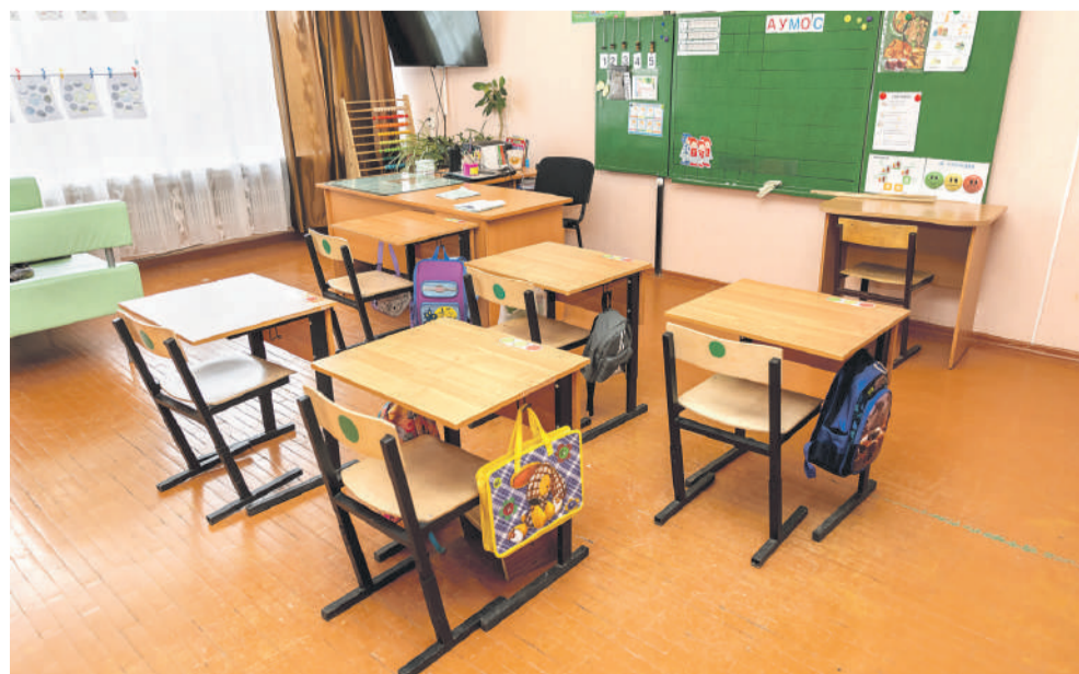
Класс для учеников с тяжёлыми интеллектуальными отклонениями

Слово «социализация» — слишком серьёзное, безликое, официальное. Но означает оно очень многое. Фактически — всю жизнь ребят в школе-интернате. Многие «особенные» дети совсем по-другому