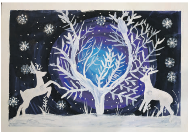
«Зимняя сказка». Рисунок Алексея Чудных (руководитель Дина Кислиця)