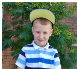
Димьян Подготовительная группа

Летом можно купаться на море, а можно ехать на речку. Летом всегда очень жарко и можно поиграть в песочнице, покататься в бассейне, кушать мороженое.