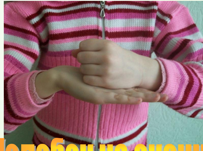
Колобок на окошке